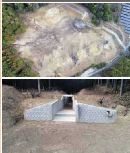
県営ため池等整備事業 小池第1地区 小池第1ため池改修第2期工事