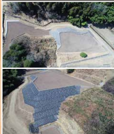
県単経営体育成基盤整備事業 下野地区他 法面保護他工事