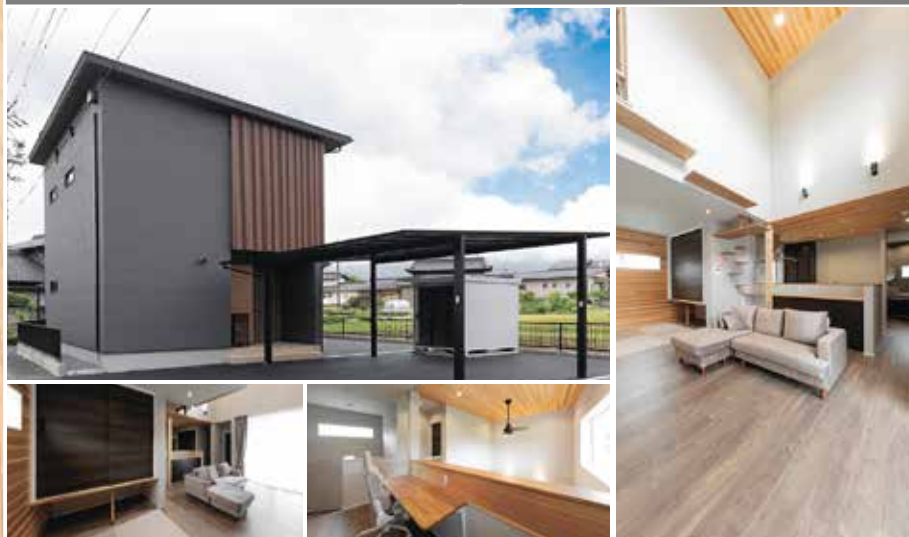
K 様邸 ◆中津川市