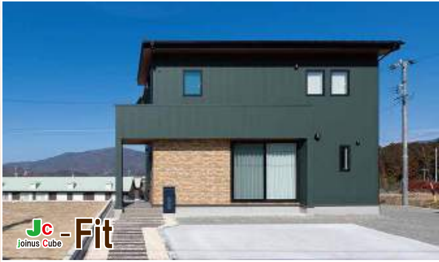
JC-Cube Fit H 様邸 ◆中津川市